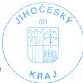
[redacted] Martin Daňhel Příjemce

Příloha: Kopie oznámení o změně příjemce dotace Kopie Smlouvy o poskytnutí dotace Jihočeského kraje v rámci dotačního programu „Kotlíkové dotace pro domácnosti s nižšími příjmy v Jihočeském kraji II.“ CZ.05.01.02/03/23_045/0001600, číslo smlouvy SDO/OEZI/4026/2023, registrační číslo 5.1/2023/66